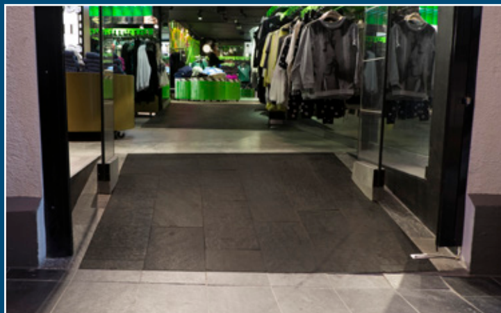
Eksempler på tilgjengelig atkomst til verneverdig bygning.